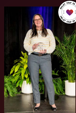
Projet Coup de coeur La Billettique Ville de Drummondville