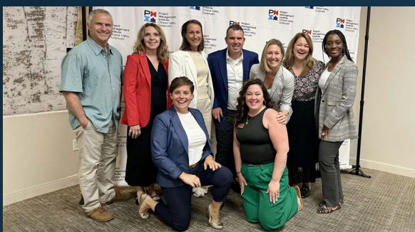
PMI Regional Conference, Ottawa, août 2025

Dans un contexte où les transformations organisationnelles et technologiques s'accroissent, notre capacité à collaborer, à apprendre des autres chapitres et à tisser des partenariats structurants devient un levier essentiel de croissance et de pertinence. Ces initiatives contribuent directement à notre mission: soutenir nos membres, enrichir notre expertise collective et positionner PMI-Montréal comme un carrefour d'échanges et d'innovation.