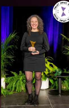
Projet à impact social de l'année Collectif Territoire