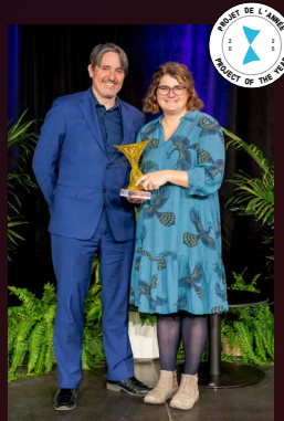
Projet de l'année Gare Lucien-L'Allier Exo